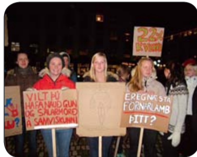
Nemendur í MA tóku virkan þátt í 16 daga átaki gegn kynbundnu ofbeldi í desember 2009.