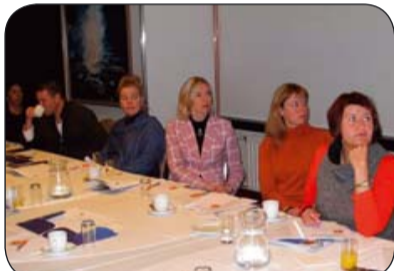
Þátttakendur í málstofu um átakið „Afnemum staðalmyndir kynjanna, leyfum hæfileikunum að njóta sín“ á Hótel KEA á Akureyri haustið 2009. Málstofur voru einnig haldnar á Hótel Sögu í Reykjavík.