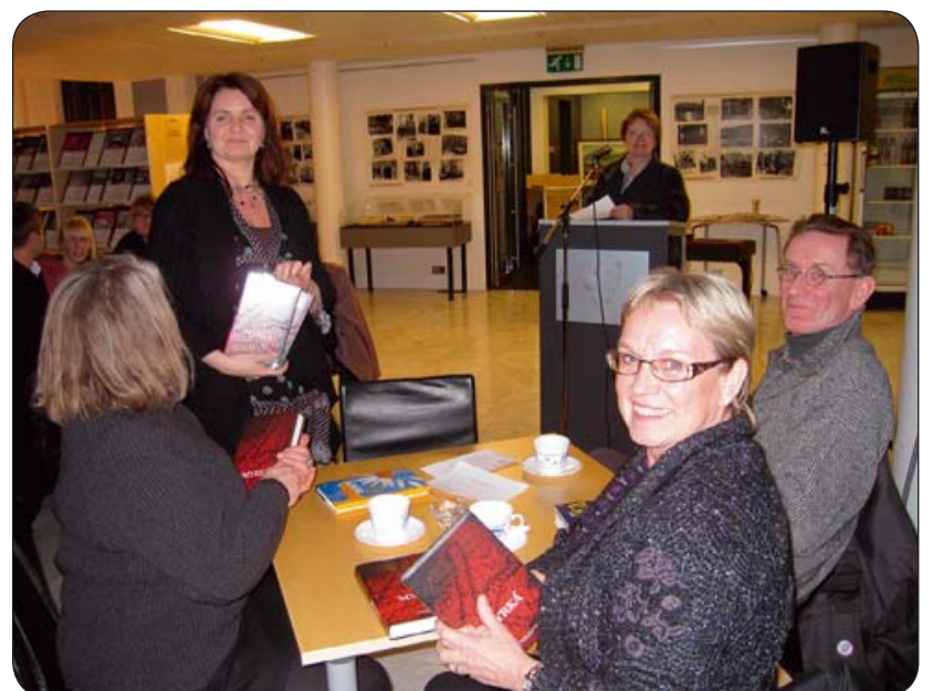
Í 16 daga átaki gegn kynbundnu ofbeldi árið 2008 lásu leikarar upp úr íslenskum bókmenntum á Amtsbókasafninu á Akureyri.

Núna hef ég áhyggjur af fæðingarorlofinu, þetta er svo mikið jafnréttismál, það má ekki skerða það þannig að foreldrar geti ekki séð sér fært að taka sér fæðingarorlof.