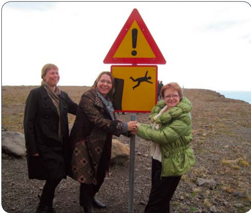
Slagið á léttu strengi á landsfundi jafnréttisnefnda á Ísafirði árið 2009.