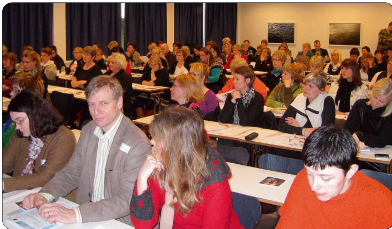
Góð þátttaka á ráðstefnu um kynbundið ofbeldi, sem haldin var í Háskólanum á Akureyri 16. apríl 2010.

Að þessu sinni er lögð mun meiri áhersla á þátttöku karla en áður og er það í samræmi við breyttar áherslur, t.d. á hinum Norðurlöndunum. Kynjajafnrétti er málefni bæði kvenna og karla.