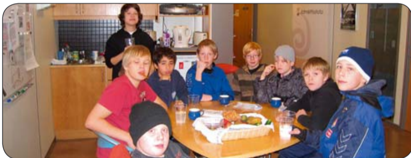
Drengir í 8. bekk í Lundarskóla heimsækja Jafnréttisstofu.